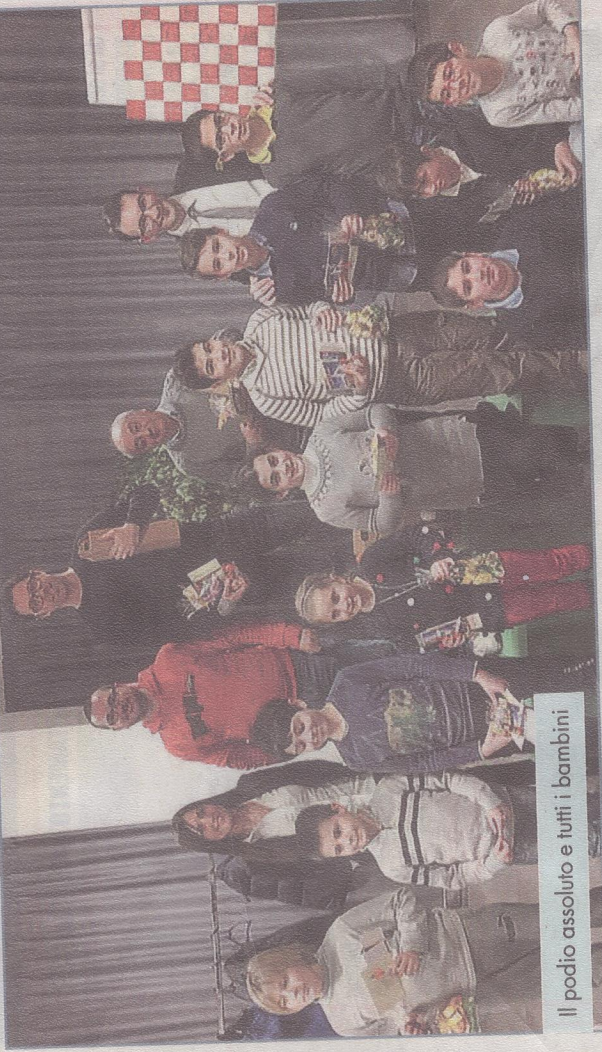
Il podio assoluto e tutti i bambini

Lampo. Inoltre, a fine maggio sarà protagonista a Bergamo del Campionato Mondiale di Dama Internazionale - specialità Lampo.